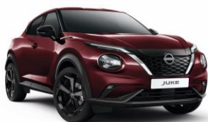
Burgundi NBQ - 160 000 Ft