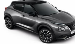
Szürke / Fekete GAQ - 300 000 Ft