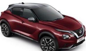
Burgundi / Ezüst XEE - 300 000 Ft