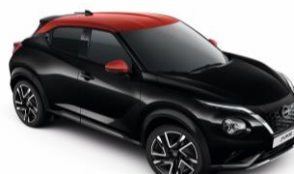
Fekete / Piros YAX - 300 000 Ft