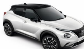
Fehér / Fekete XKJ - 300 000 Ft