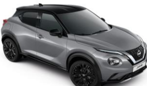
Szürke / Fekete XEX - 300 000 Ft