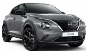
Gyöngyházsürke KBY - 160 000 Ft