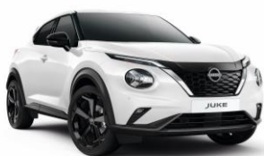
Fehér 326 - 70 000 Ft