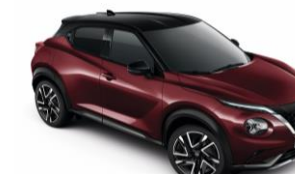
Burgundi / Fekete XDO - 300 000 Ft