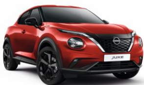
Piros Z10 - 0 Ft