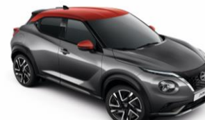
Szürke / Piros XFB - 300 000 Ft