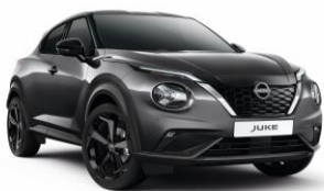
Szürke KAD - 160 000 Ft