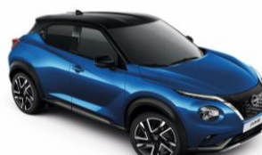
Élénkkek / Fekete XGZ - 300 000 Ft