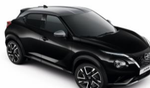
Fekete / Ezüst YAY - 300 000 Ft