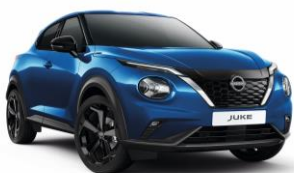
Élénkkek RCF - 160 000 Ft